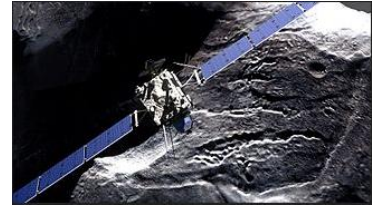
La sonde spatiale Rosetta

Rosetta est une mission spatiale de l'Agence spatiale européenne (ASE/ESA) dont l'objectif principal est de recueillir des données sur la composition du noyau de la comète 67P Churyumov-Gerasimenko et sur son comportement à l'approche du Soleil.