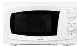
Four à micro-ondes