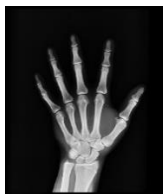
Radiographie d'une main