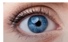
L'œil, un récepteur d'onde EM