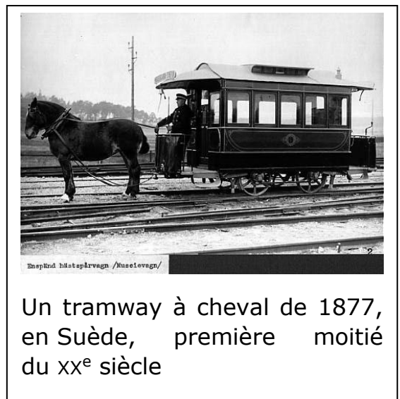
Un tramway à cheval de 1877, en Suède, première moitié du xx e siècle

Le cheval-vapeur électrique est défini comme valant 1 \text{ ch} = 735,5 \text{ watt} .