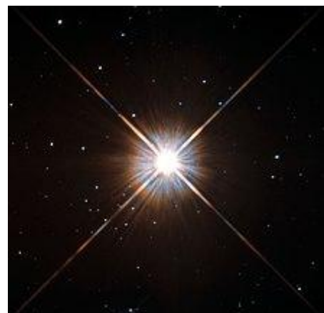
L'étoile Proxima du Centaure