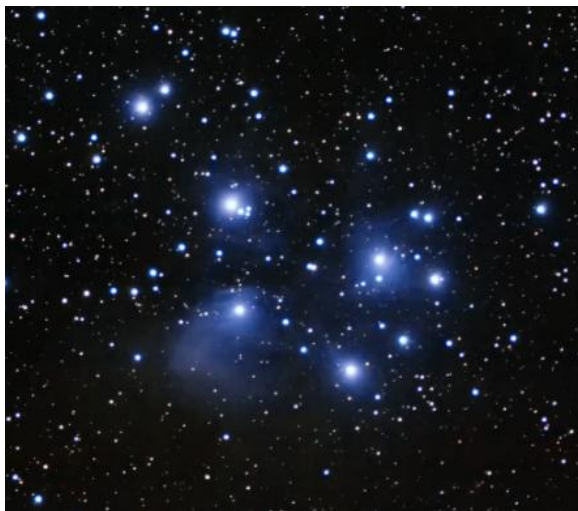
Amas des Pléiades ou amas M45