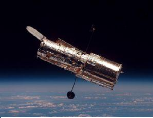
Le télescope Hubble, un exemple de satellite artificiel